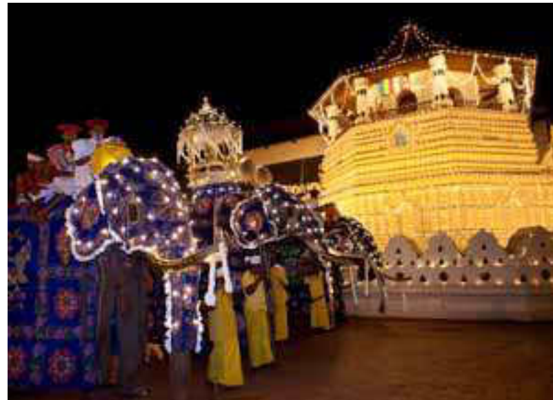
දළදා පෙරහර

‘පාහි යන්ගේ’ දේශාටන වාර්තාවේ සඳහන් වන විදියට ‘දළදා ගේ’ සන් රුවනින් ඉදි කරපු මන්දිරයක්. අනුරාධපුරය ගැන එතුමා මෙසේ කියනවා: